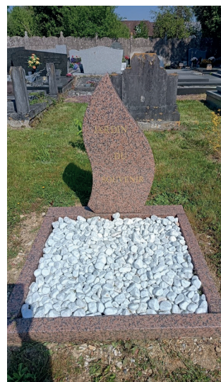
Le jardin du souvenir

Les nouvelles cavurnes ont été installées au cimetière de Lucheux. Le jardin du souvenir, espace de dispersion des cendres des défunts ayant fait l'objet d'une crémation, est maintenant opérationnel.